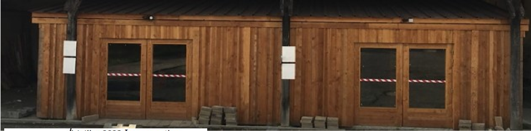
11 juillet 2023 Inauguration