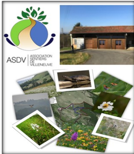
Association des Sentiers de Villeneuve